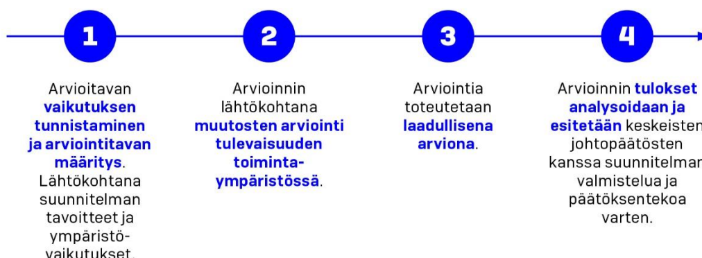
Kuva 4. Vaikutusten arvioinnin eteneminen.

Arvioinnin valmisteluvaiheet on esitetty pääpiirteissään kuvassa 4. Vaikutusten arviointia raamittaa arviointikehikko, johon on kuvattu arvioitavat vaikutusalueet. Vaikutusalueet on kytketty suunnitelmalle asetettuihin tavoitteisiin (liite 2), mikä tehnyt tavoitteiden toteutumisen arvioinnista systemaattista ja läpinäkyvää.