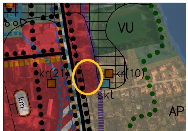
Ote yleiskaavayhdistelmästä. Muutosalueen likimääräinen sijainti ympyröity keltaisella.

Muutosalueella on voimassa vuonna 2018 hyväksytty Ydinkeskustan osayleiskaava 2040. Korttelin 85 alue sijoittuu kaupunkikeskustan kehittämisvyöhykkeen alueelle, joka on osoitettu tiivistävän keskustaajamatoimintojen alueeksi (C2). Kuruntien itäpuolelle painottuva aluerajaus on merkitty seudullisesti merkittäväksi suuryksikkötoimintojen alueeksi (km). Kuruntien ja muutosalueen väliin on osoitettu kevyenliikenteen reitti.