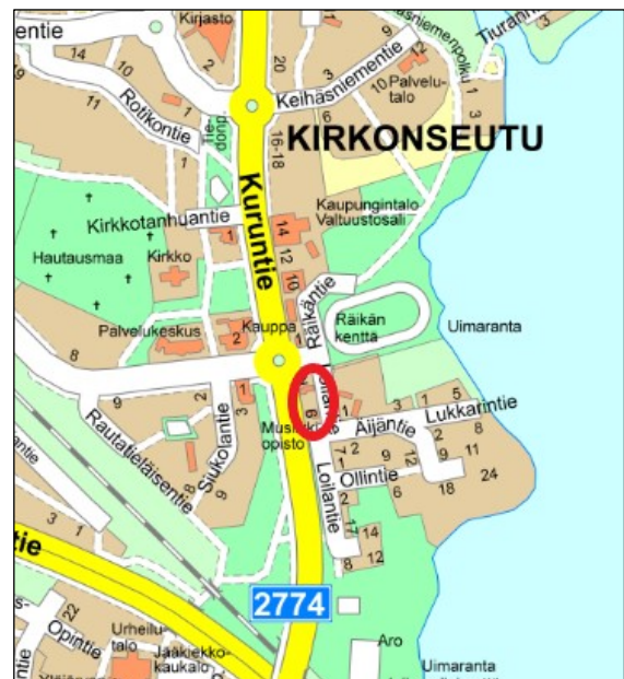
Suunnittelualue merkitty punaisella opaskarttaan

Asemakaavan muutosalue sijaitsee Ylöjärven Kirkonseudun keskustan alueella. Suunnittelukohte on Kuruntien ja Loilantien risteuksen tuntumassa. Kaavamutosaluetta rajaa lännestä Kuruntie ja idästä-etelä suunnasta Loilantie. Muutosalueen pohjoispuolella sijaitsee asuin-, liike- ja toimistorakennusten korttelialue (AL). Kortteliin valmistui vuosina 2019-2020 asuin-kerrostalot, joiden katutasoon sijoitettu toimistotiloja. Muutosalueella on sijainnut kaupungin omistamia rakennuksia, kuten musiikkiopiston talo, jotka on purettu vuosien 2018-2021 välisenä aikana. Kaava-alueen kokonaispinta-ala on noin 5 100m 2 .