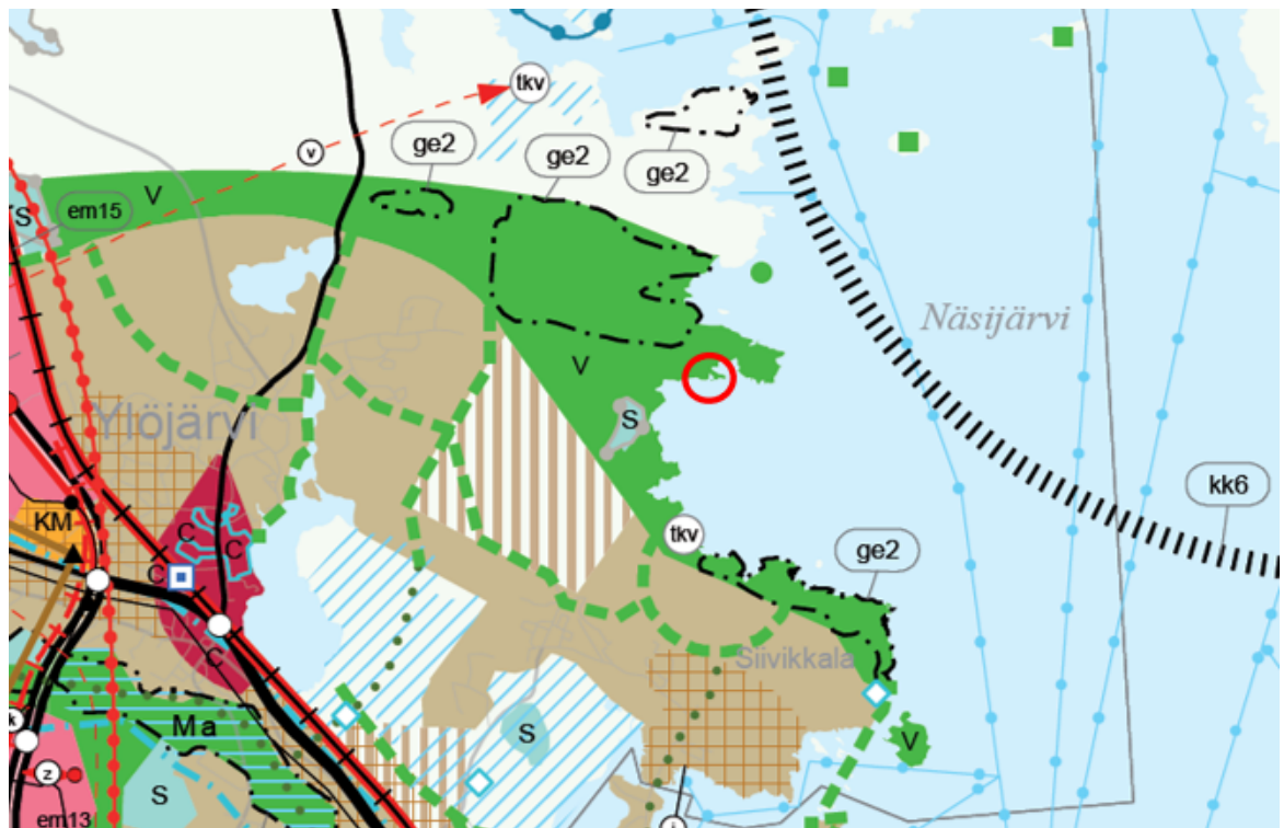
Kuva 3. Ote Pirkanmaan maakuntakaavasta 2040. Suunnittelualueen likimääräinen sijainti on osoitettu punaisella ympyrällä.

Suunnittelualueella ei sijaitse maakuntakaava 2040:n oikeudellisissa liitteissä esitettyjä pieniä luonnonsuojelualueita, valtakunnallisesti arvokkaita soita eikä alueelle sijoitu maakunnallisesti merkittäviä rakennetun kulttuuriympäristön kohteita.