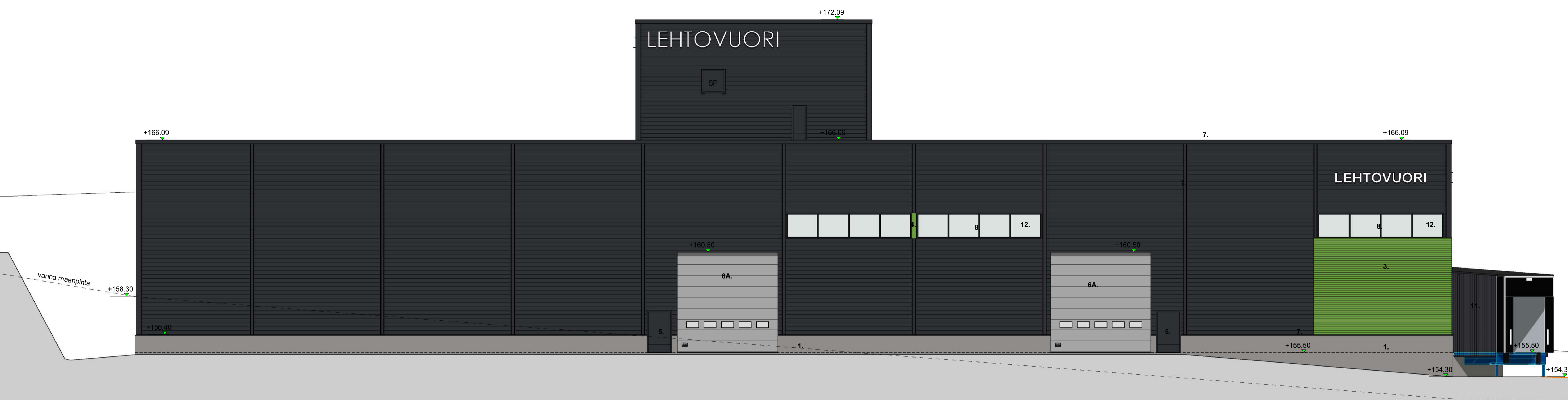
JULKISIVU KOILLISEEN 1:100