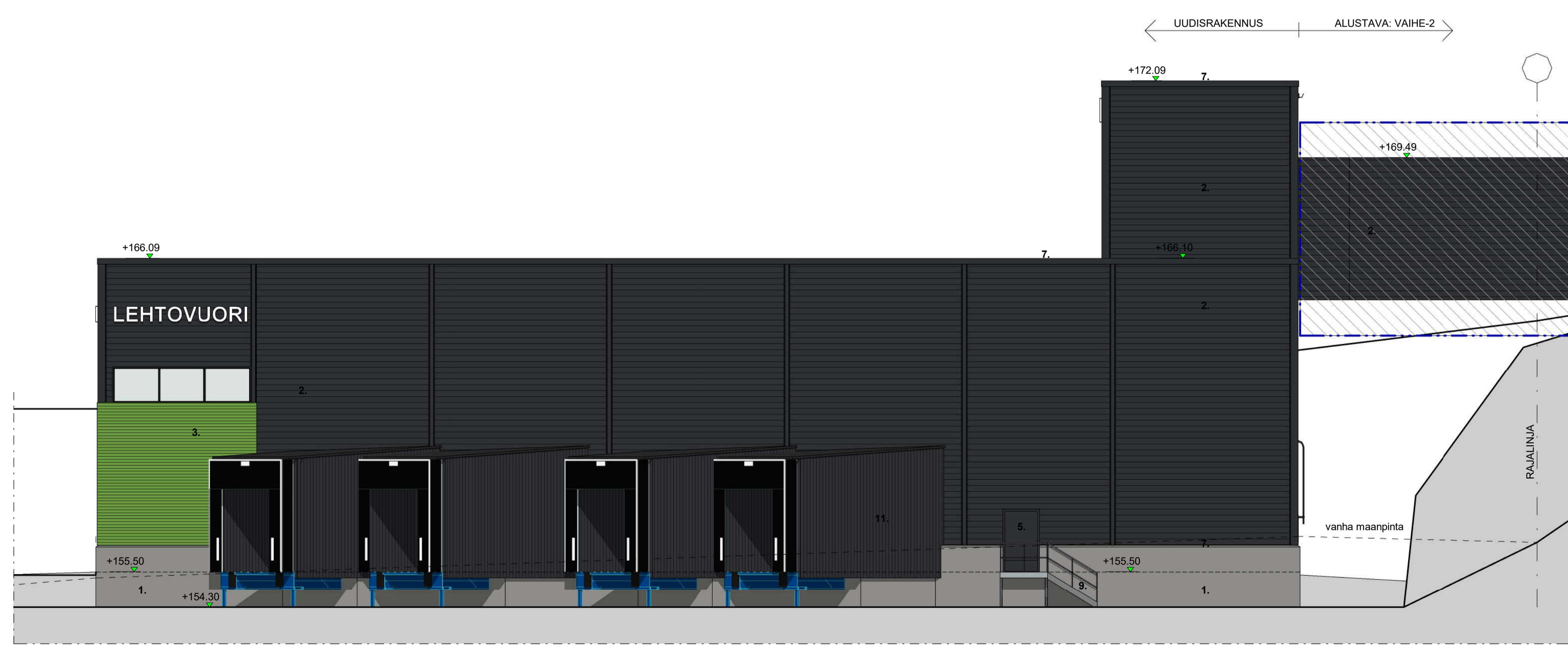
JULKISIVU LUOTEeseen / BETONITIELLE 1:100